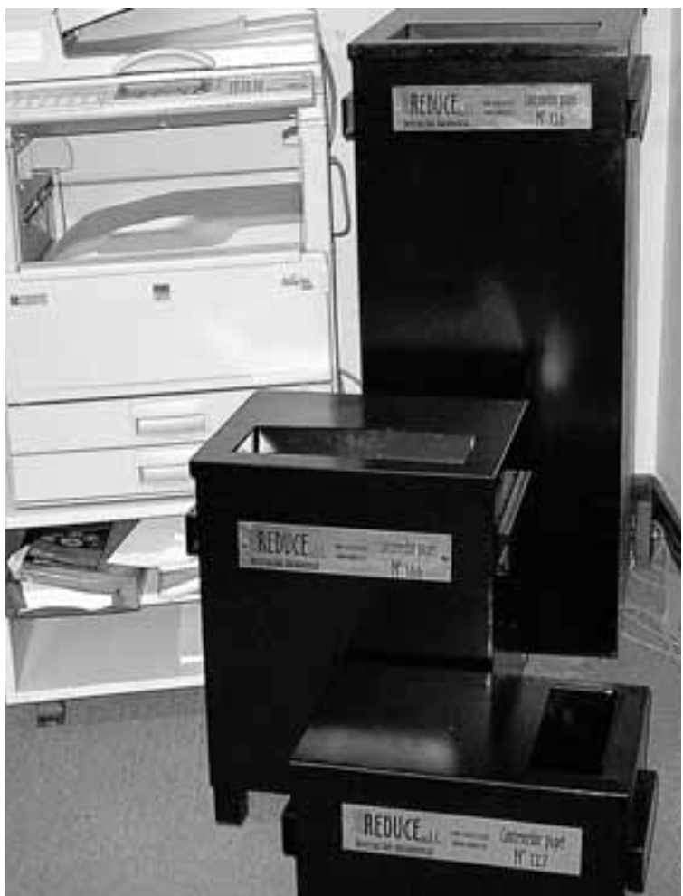
La empresa Reduce cuenta con contenedores metálicos y herméticos.